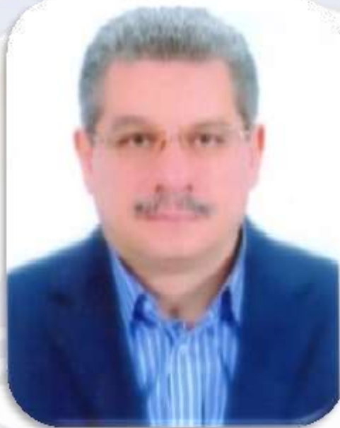
أ.د/ أمين السيد لطفي رئيس جامعة بني سويف