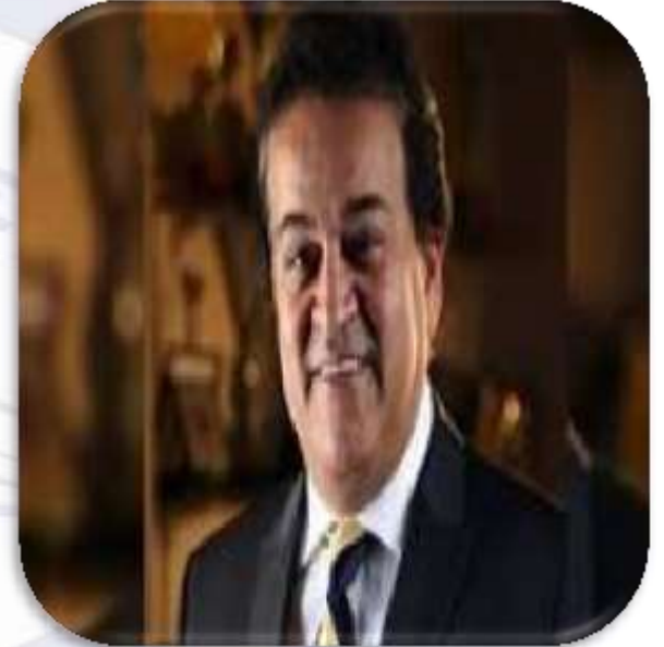
أ.د/ خالد عبد الغفار وزير التعليم العالي