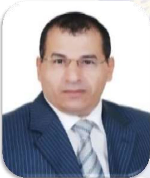
أ.د/ جودة مبروك محمد عميد كلية الآداب